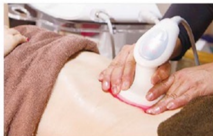
1台5役の最新脂肪燃焼マシン!